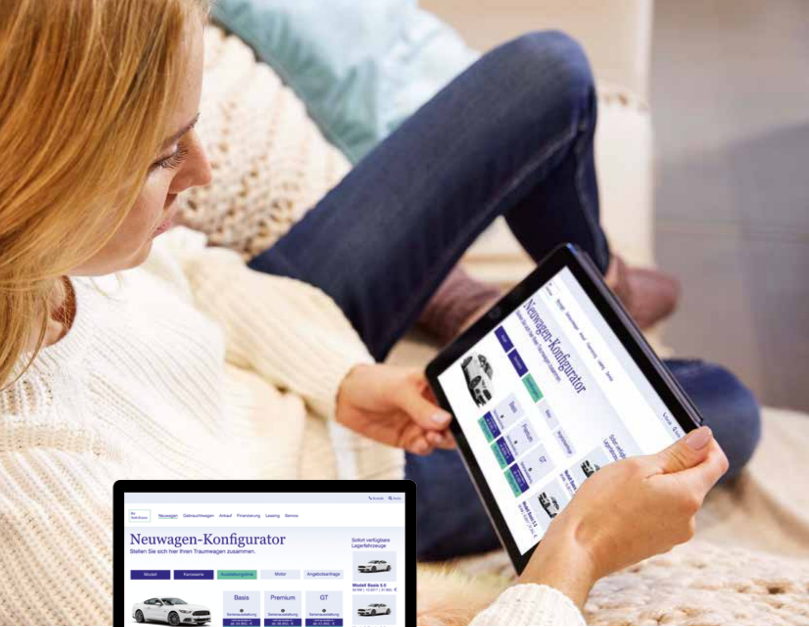
Zwei weitere Vorteile des DIGEO Neuwagenkonfigurator: problemlose Installation und eine flexible Anpassung an Ihr Website-Design.